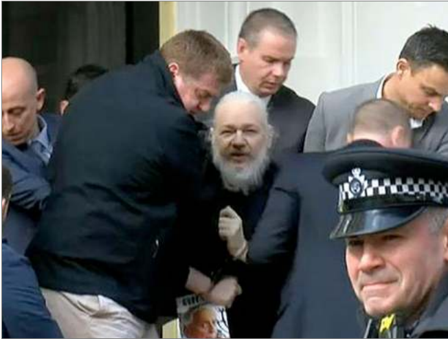
Die Verhaftung von Julian Assange am 11. April 2019.