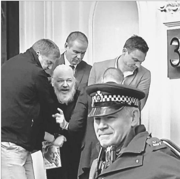
Verhaftung von Julian Assange am 11. April 2019.

In Solidarität mit Julian Assange | Für das Recht auf Freiheit im Informations- und Bildungswesen