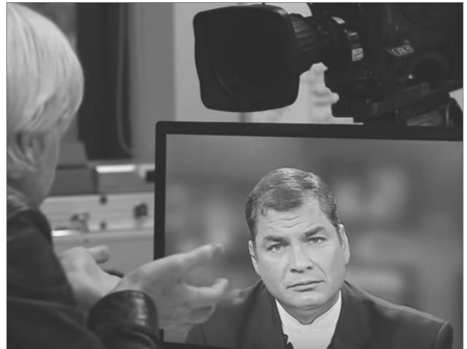
Präsident Rafael Correa von Julian Assange interviewt, Mai 2012 23

Dennoch – ich möchte nichts vorwegnehmen –, doch die bloße Tatsache, dass sie das Asylrecht verletzen und einer Person, die unter dem Schutz des Staates Ecuador stand, das Asyl entziehen und somit unser Land erniedrigen, indem sie es der britischen Polizei erlaubten, unsere Botschaft zu betreten, um einen ecuadorianischen Staatsbürger, der Asyl erhalten hatte, festzunehmen, das ist verheerend! Ich denke aber, dass die Folgen noch schwerwiegender sein werden. Wie gesagt, ich möchte nichts vorwegnehmen, doch die Wahrscheinlichkeit, dass Großbritannien Julian Assange nicht an die Vereinigten Staaten ausliefern wird, ist sehr gering.